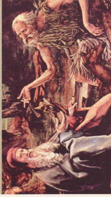
Der Iserheimer Altar von Matthias Grünewald: Im linken Flügel ist der Besuch des Hl. Antonius beim Eremiten Paulus von Theben zu sehen.

Die Antoniter nannten sich nach dem Einsiedlermönch in der ägyptischen Wüste, Antonius dem Großen, dessen Versuchen durch Dämonen Matthias Grünewald auf dem Iserheimer Altar in Colmar dargestellt hat. Um 1100 bildete sich in Südf Frankreich eine Laienbruderschaft zum freiwilligen Dienst an Kranken. Daraus entstand ein Hospitalorden. Um 1290 gründeten die Antoniter auch in Freiburg einen Konvent, das so genannte kleine Präzeptorat.