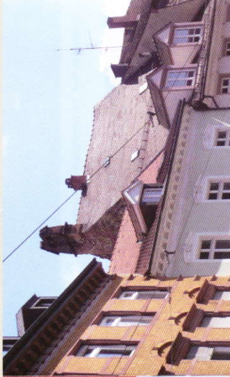
Von unten kaum sichtbar: Lücken im Ziegeldach des Antoniterhauses müssen schnell verschlossen werden.

Der Verein Denkmalpflege in Freiburg i. Br. e.V. setzt sich mit Unterstützung der Arbeitsgemeinschaft Freiburger Stadtbild e.V. dafür ein, das wertvolle Bauwerk in seinem Bestand zu sichern. Lücken im Ziegeldach müssen geschlossen, Glockenturm und Giebelwand gegen weiteren Verfall geschützt werden. Vor allem der Turm hat hohen historischen Wert: Die Antoniter riefen per Glockenschlag zum Gebet im unteren Kirchenraum des Hauses. Die Kosten der Erhaltungssicherung werden von Gutachtern auf 45.000 € bis 50.000 € geschätzt.