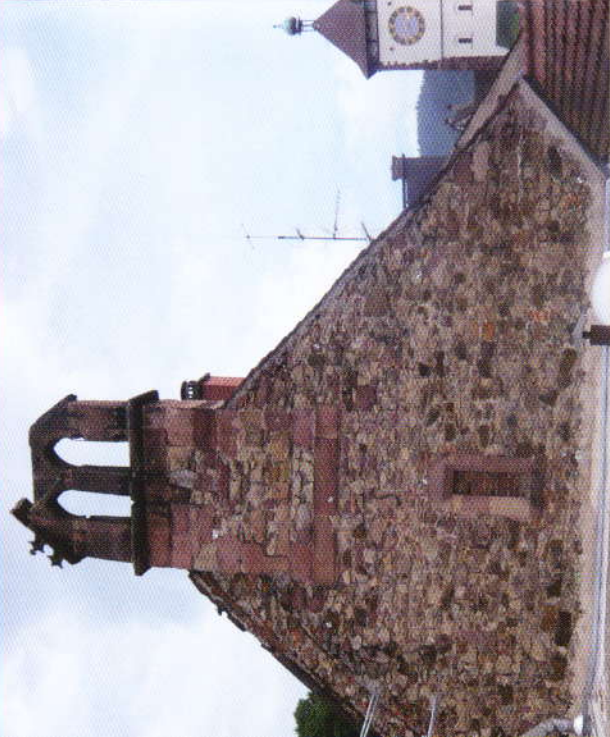
Mit Ihrer Spende kann der stark beschädigte Glockenstuhl endlich saniert werden.

Bitte spenden Sie jetzt für die Sanierung des Antoniterhauses und erhalten Sie mit uns ein Stück Freiburger Stadtgeschichte.